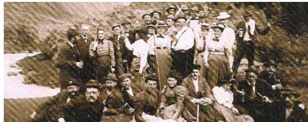
Eröffnung der Weganlage am 18. August 1899